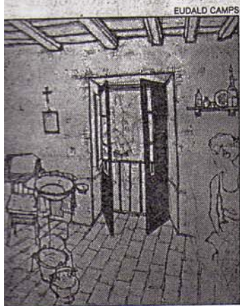
Un dibuix de Joan de Palau

El muntatge de l'exposició respon a una clara voluntat divulgativa.