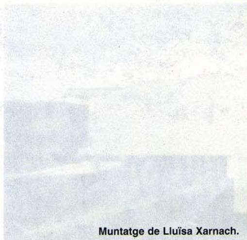
Muntatge de Lluïsa Xarnach.

Situació: Plaça de Sta. Llúcia, 1. 17004 -Girona- Horaris: De dimecres a dissabte, de 18 a 21 hores